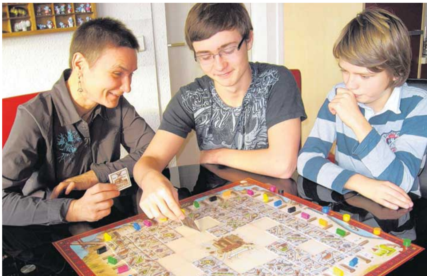
Spielen macht Spaß: Hier geht es für die Mitspieler darum, wer die längsten Cable-Car-Linien durch San Francisco erbaut.

Mehr Abwechslung für Romméfans: Den Royal Flush mit 25 Punkten wollen alle. In diesem mit Pokerspannung garnierten Romméspiel sammeln alle die gerade geforderten Kartenkombinationen in der Hand – vom Zwilling bis zum Full House. Jeder kann reihum eine Karte aufnehmen und weiter sammeln oder die Aus-